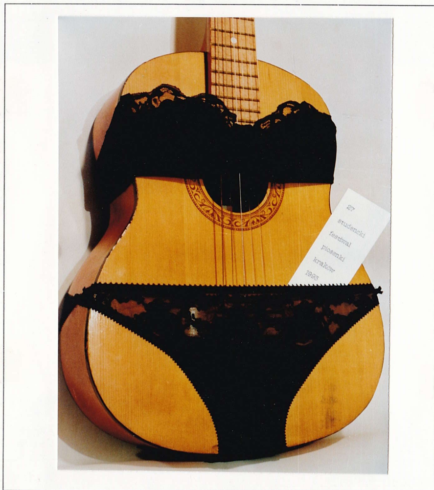
PLAKAT STUDENCKIEGO FESTIWALU W KRAKOWIE